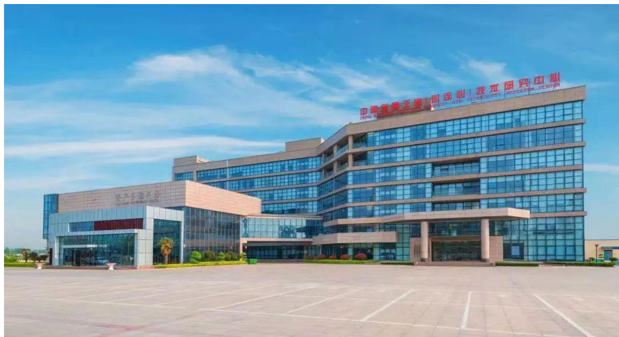
中国氮肥工业（心连心）技术研究中心