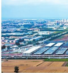
“长封一体”产地产业园区建设进展。