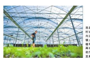
7月7日，原阳县高标准农田示范区，农民在田间进行农事操作。