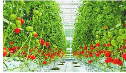
许昌市水木水电和中通渠工厂，四五米高的镀锌板上挂满了西红柿。