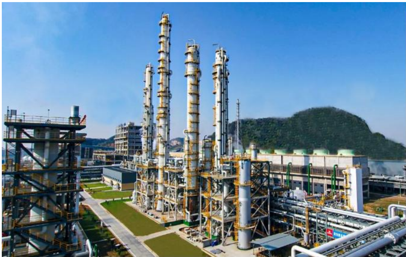
生产系统低温甲醇洗装置航拍图

甲醇是低温甲醇洗装置的重要介质之一。为提升甲醇势能利用率，保障资源利用最大化，满足工艺需求，公司成立攻坚项目组。通过项目成员反复研究，拿出多个方案层层论证，最终自主研发出资源利用最大化的设计方案。