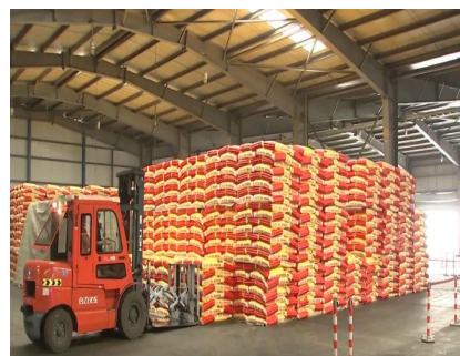
心连心新疆基地成品仓库