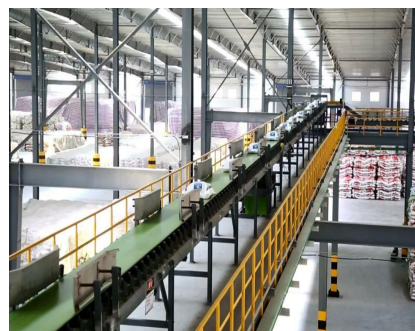
心连心新乡基地生产线