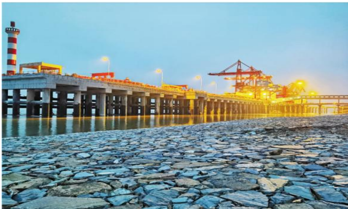
夜幕下的心连心集团江西九江基地